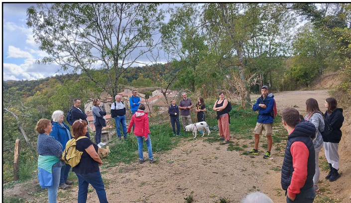
Balade du 14 octobre en partenariat avec le département.