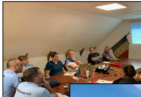
Bilan semestriel avec la gendarmerie et les maires des communes voisines