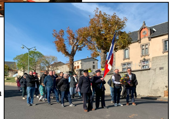
Commémoration du 11 Novembre 2023