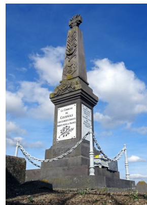
Réfection des plaques du monument aux morts

Les projets prévus pour 2016, tels que le complément d'éclairage sur l'entrée de Chabannes et dans le village de Randol, la réserve incendie de Randol, n'ayant pu se faire, seront donc réalisés en début d'année 2017. S'ajouteront aussi des travaux sur la voirie communale et divers chemins dans nos 3 villages ainsi que des protections autour des bacs à ordures. Il est aussi prévu des aménagements, au cimetière afin de proposer un columbarium. Plusieurs réflexions sont engagées autour de la sécurité dans la traversée du bourg, sur la destination de certains bâtiments communaux, et l'évolution de notre règlement d'urbanisme.