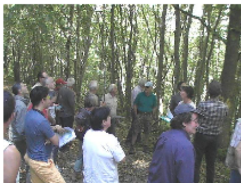
9/9/2016 Gestion d'une forêt de feuillus.

Bien sûr, nous avons poursuivi nos animations maintenant habituelles auprès de nos adhérents : études de situations forestières; prestations (recherches de bornes et limites); etc.. Ceci se déroule toujours en étroite collaboration avec le Centre National de la Propriété Forestière, notre référent technique. Nous avons également réalisé deux présentations sur le thème de la forêt auprès des élèves de CM2, écoles de Pontgibaud et Verneugheol. Côté matériel, nous continuons à nous équiper grâce à l'aide financière 2016 du Conseil Départemental du Puy de Dôme.