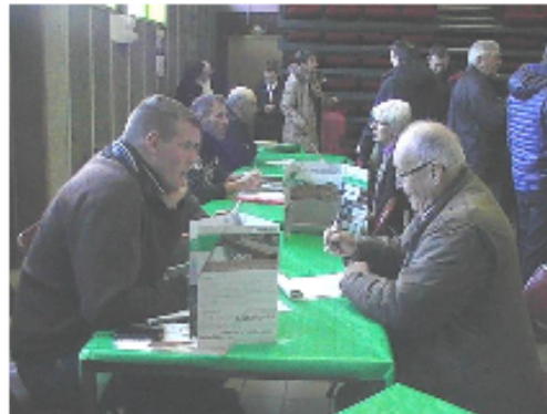
9/12/2016 Forum d'entreprises forestières

Si notre association vous intéresse, même à titre de découverte, n'hésitez pas à nous contacter.